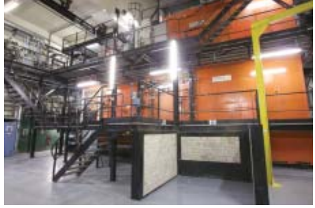
Le four d'incinération Incineration furnace