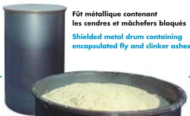
Fût métallique contenant les cendres et mâchefers bloqués Shielded metal drum containing encapsulated fly and clinker ashes

Le volume des déchets ainsi incinérés et conditionnés est réduit jusqu'à un facteur 20.