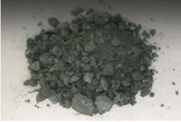
Mâchefers issus de l'incinération Clinker resulting from incineration